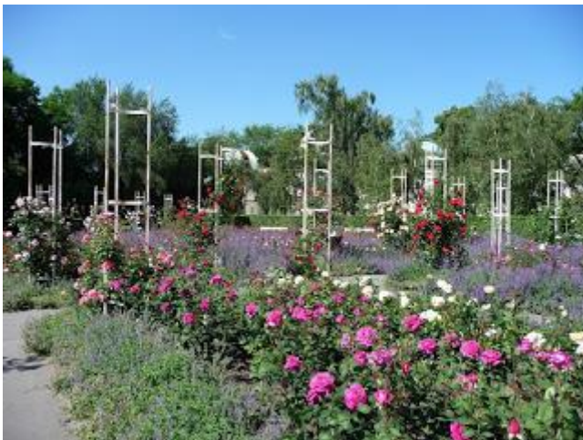
Rozárium na Petřine v Prahe.

Predmetná zelená plocha sa nachádza medzi parčíkom na Drevnom trhu a električkovou zastávkou Senný trh a je vo vlastníctve mesta Košice. Veľkosť plochy je cca 2340 m 2 s rozmermi cca 63 x 27 x 68 x 45 metrov (podľa gisplánu). Existujúca zeleň zahŕňa skupinku borievok, smrekov pichľavých, agátov a pagaštan. Západná polovica plochy je momentálne oplotená a slúži ako venčovisko. Vedľa neho bola v septembri 2018 odhalená socha Ľudovíta Felda a následne plocha pomenovaná ako Feldov park. Celkovo inak nie je plocha nijako využívaná a pýta si nové využitie, pretože sa nachádza medzi významnými bodmi, akým sú plaváreň, obchodné centrum, stanica a centrum mesta. Navrhovaná Ružová záhrada prinesie do centra pestrofarebnú zeleň, nové miesto pre relax a príjemné posedenie. Zároveň sa zvýši záujem ľudí o verejný priestor, zeleň ako takú a motivuje ich stráviť viac času vonku. Záhrady ruží sú vo svete populárne, ako príklad uvádzam ružovú záhradu na Petřine v Prahe , v parku Bagatelle v Paríži a rozárium v Sade Janka Kráľa v Bratislave .