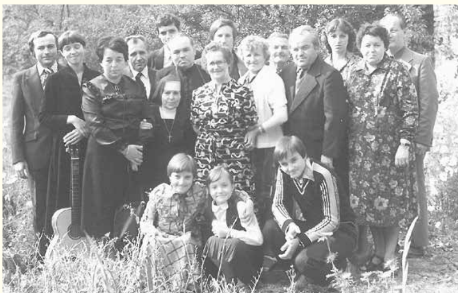
■ V kruhu blízkej rodiny.