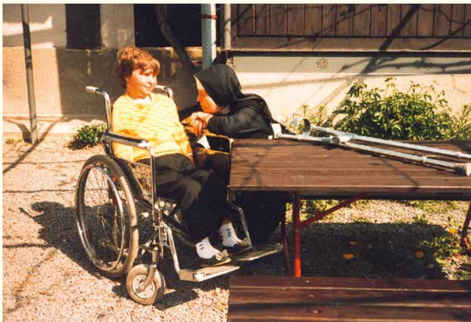
■ Aj takto – v dôvernom rozhovore – sa formovali chorí.