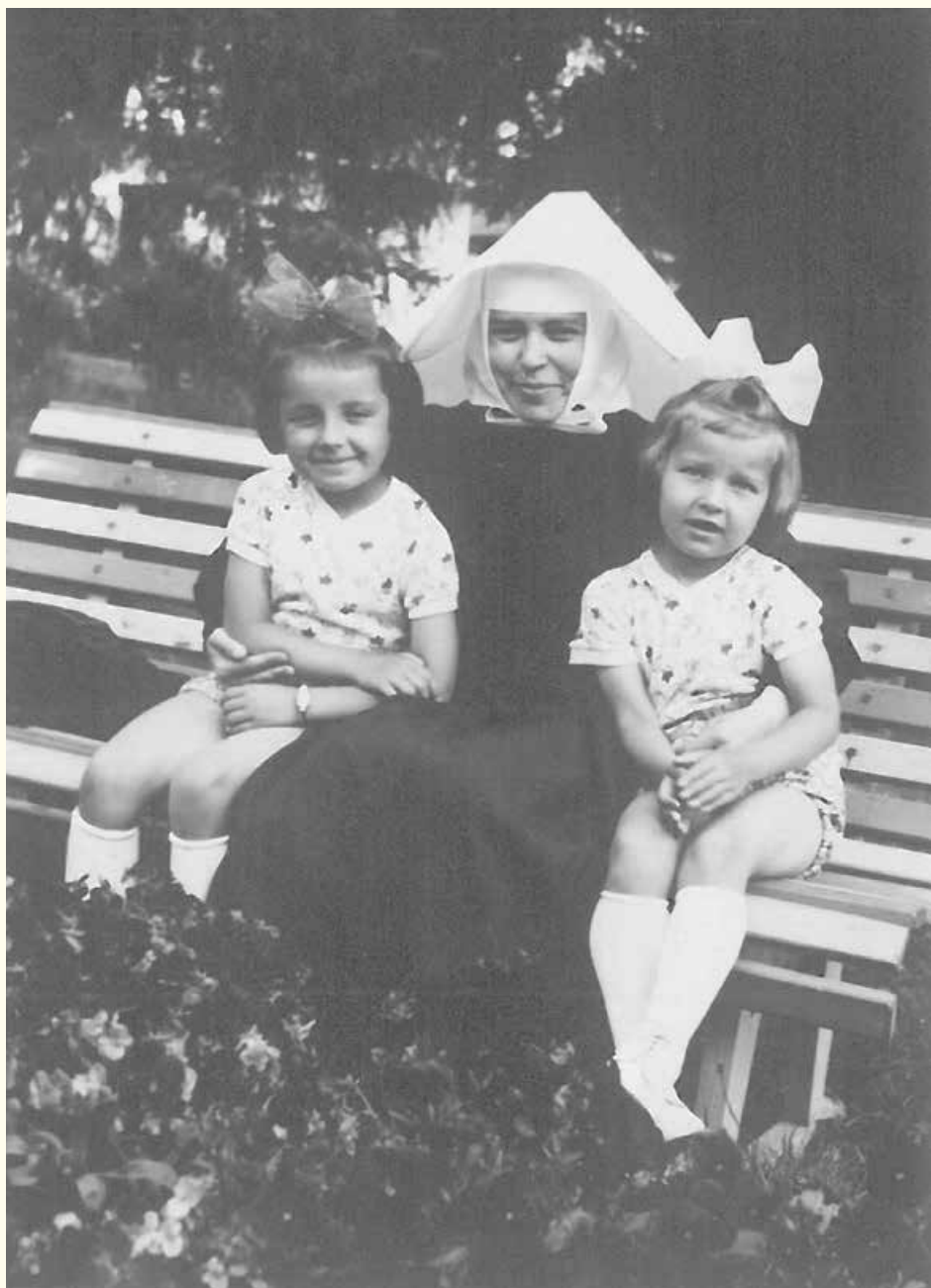
■ Ako malá sestra medzi maličkými.