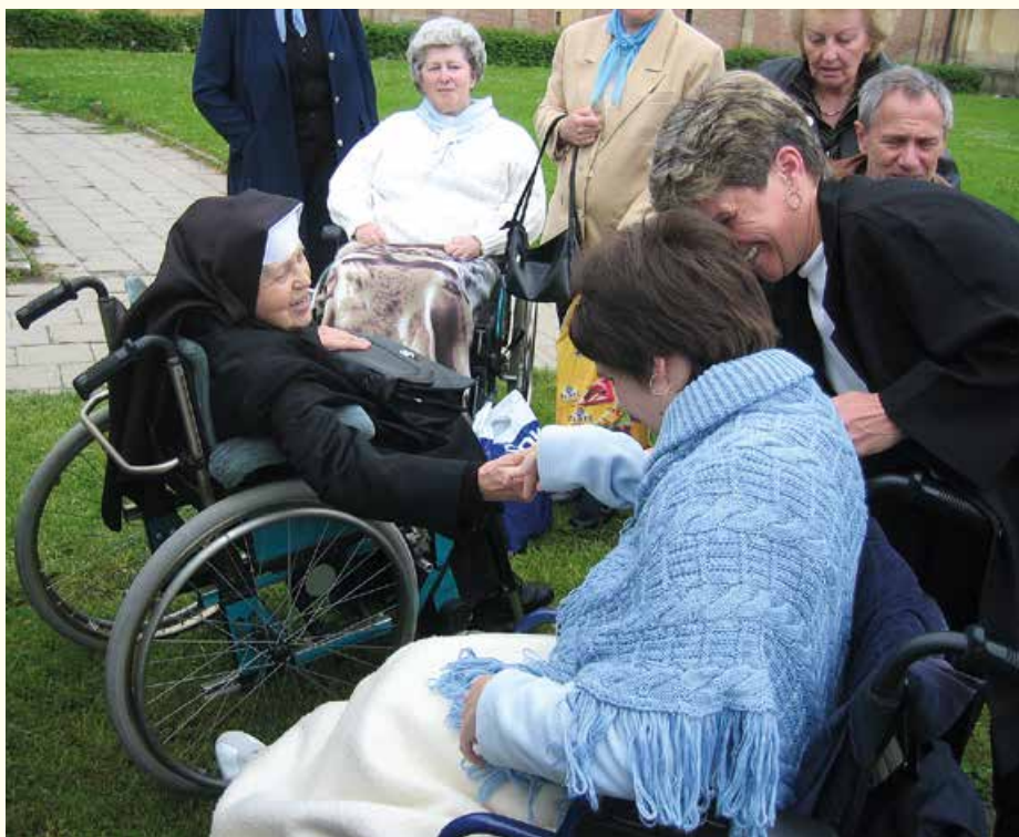
■ Chorá medzi chorými.

Pacientky, ktoré sa v nemocnici spoločne modlievali ruženec, chceli v tom pokračovať aj po návrate domov. Rozhodnutie založiť spoločenstvo chorých, ktorí sa budú denne modliť ruženec, dozrelo na Turíce. To bola